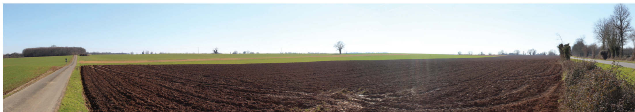
Vue panoramique de l'état initial (angle de vue 120°)