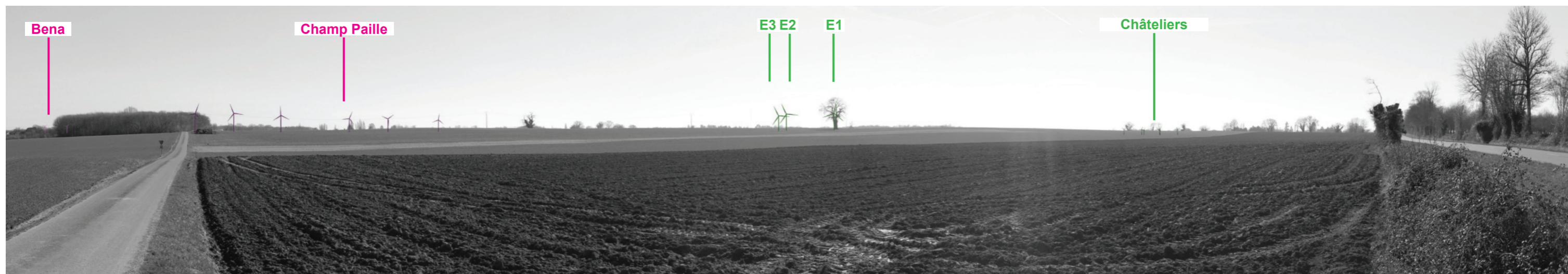
Vue panoramique noir et blanc avec esquisse du projet (angle de vue 120°)